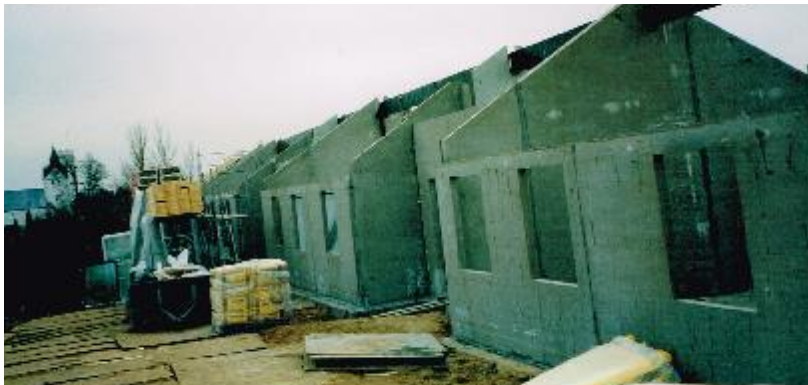
Billedet er fra februar 2004